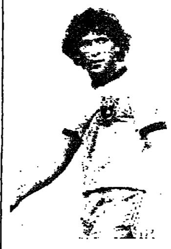
ابدى نجوم البرازيل الكرويون ، وفي طليعتهم اللاعب زيكو خولهم من ان يتم تعيين ماريزو زغالو مربيا جديدا للمنتخب البرازيل في حملته نحو نهائيات كأس العالم ، وذلك في الاجتماع الذي يعقده الاتحاد لهذه الغاية يوم ١٦ كانون الثاني المقبل .

وإذا تولى زغالو الاشراف على المنتخب فله سوف يطبع بسماه عدة برزت في نهائيات كأس العالم والبطولات مثل زيكو وسفراط وفلكو ان لم نورد سوى ٣ أسماء :